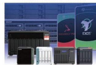
2017年8月 バックアップシステム「GUARDIAN+R」サービス開始

データ復旧事業で学んだ技術と新たな技術の開発により、裁判所で使用できる証拠保存やデータ調査サービスを提供することが可能になりました