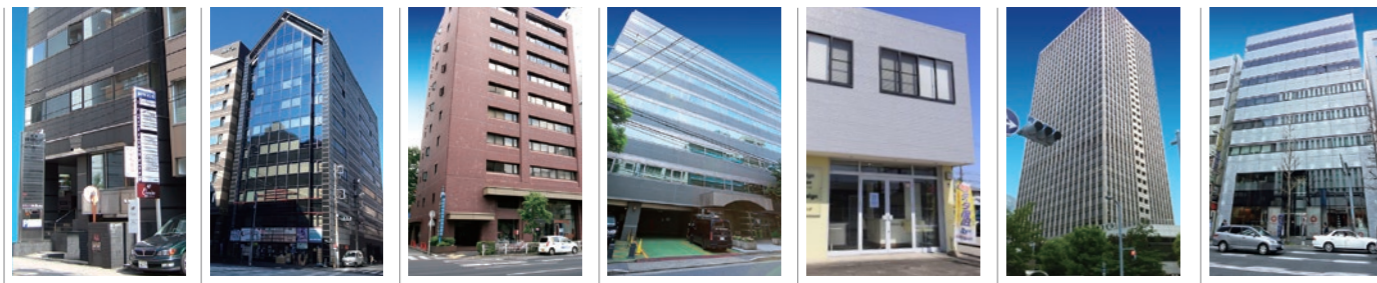
札幌 秋葉原 横浜 名古屋 大治 大阪 福岡