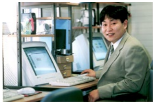
1999年6月 リップルネットを創業