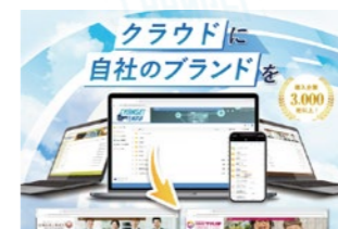
2018年9月 クラウドストレージ「CHANGE!TENMA」サービス開始

「バックアップを強化したい!」というお客様のご要望に応え、QNAP社と代理販売契約を結び、災害対策に特化したバックアップシステムをリリース