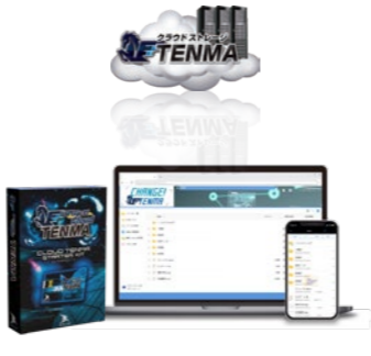
2012年7月 クラウドストレージサービス「TENMA」サービス開始

現在事業の要となっているデータ復旧サービスを2008年に開始し加速度的に売り上げを伸ばし始めます