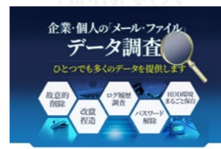
2016年8月 デジタルフォレンジック「DIGITAL FORENSIC 24」サービス開始

お客様のデータを消失の危機から完全に守るためクラウドストレージサービスTENMAの運営を開始しました