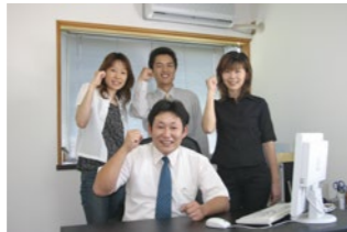
2003年7月 株式会社リプラス設立

リップルネットからリプラスへと生まれ変わり、会社としてさらに一回り大きくなりました