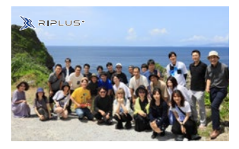
2022年7月 株式会社リプラス設立20周年記念事業実施

クラウドを通じてデータ送信を行う際も「御社のブランドを冠したクラウド」でデータのやり取りが可能に! まるで自社クラウドのようTENMAが使い易く進化しました